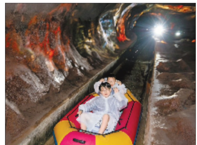
全长858米的地下漂流河道,营造出“星际穿越”般的体验。