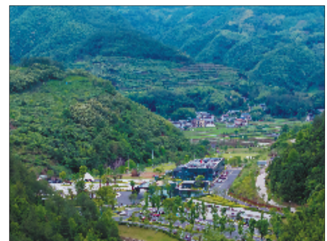
废旧矿区成为旅游亮点,带动周边民宿、农家乐等业态的兴起。