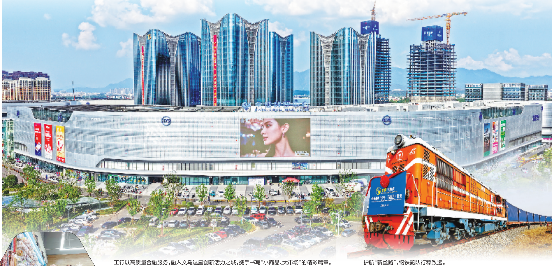
工行以高质量金融服务，融入义乌这座创新活力之城，携手书写“小商品、大市场”的精彩篇章。