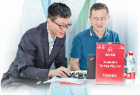
金融架设“金桥”。工行“浙里买全球”义乌对接会现场，境内外企业实现精准对接。