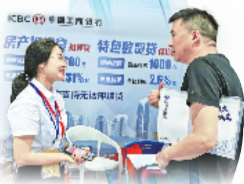
针对全球数贸中心招商阶段的商户融资难题，工行创新推出“特色数贸贷”，为入驻商户提供高效金融支持。