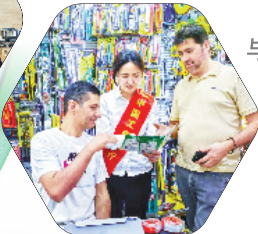
工行客户经理走访在义乌国际商贸城经商的外国客商，深入了解金融需求。