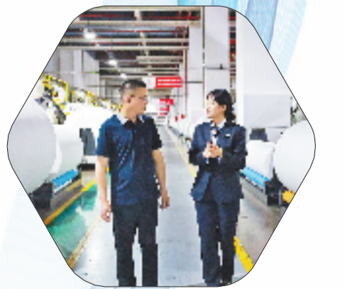
小商品、大产业。工行以金融活水浇灌义乌实体经济，推动特色产业群跃迁。

在义乌驾着集装箱通达四海的征程上，工行浙江省分行始终是坚定的“护航者”，以专业金融服务搭建全球