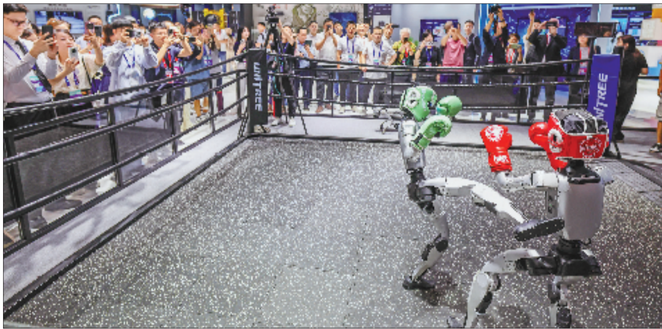
2025年9月,在第四届全球数字贸易博览会数智未来主题展区的杭州六小龙专区,宇树科技的人形机器人在进行格斗擂台赛。

居全国第四,这离不开民营企业在人工智能、人形机器人等领域展现出的充沛活力。因此,浙江要坚持强化企业的创新主体地位,让企业在创新大潮中“唱主角”,为建设生命力旺盛、根植力强大的创新生态不断注入活力。