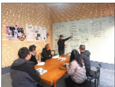
“六点半茶铺”里,大家一起坐下议事。

农户提供冷藏保鲜服务,支持葡萄错峰、反季销售,延长销售周期。此外,依托“田管家”驻点服务,每周都有党员志愿者和农技专家前来坐诊,通过设置“专家名片墙”和“疑难问题征集箱”,实现“庄稼医院”随时开放,形成“农户一党员一专家”无缝衔接的服务链条,打通科技进村入户“最后一公里”。 产业强筋健骨,服务也跟上趟。八字农事服务中心的农民驿站常年提供季节饮品、农具共享等暖心服务,成为大伙儿在农忙时候的歇脚处。“省心事务所”里,“红色代办员”轮流值守,事务代办、费用代缴、政策咨询一站搞定,