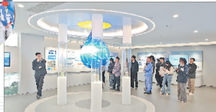
知识产权联合法治服务