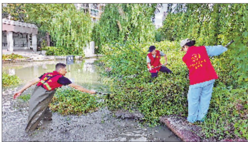
爱河队成员清理河道

所谓“五公开”，即小区事务公开、财务收支公开、物业服务标准公开、公共收益分配公开、监督评价结果公开。其中，财务透明是居民最关心的重要环节。与传统物业模式下业主与物业的“买卖关系”不同，信托制将物业费、公共收益等全部存入公开的共管账户，支出按约定预算执行，所有明细全部公开，接受业主监督。