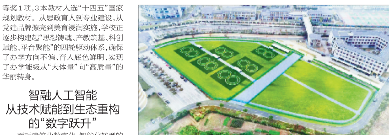
该校无人机应用技术专业与中测航空共建无人机专业订单班，校企共建30亩室外飞行实训基地，共同开展无人机行业应用与CAAC执照培训。

等奖1项，3本教材入选“十四五”国家规划教材。从思政育人到专业建设，从党建品牌擦亮到美育浸润实施，学校正逐步构建起“思想铸魂、产教筑基、科创赋能、平台聚能”的四轮驱动体系，确保了办学方向不偏、育人底色鲜明，实现了办学能级从“大体量”向“高质量”的华丽转身。