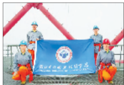
浙建院学生团队登上380米的世界最高跨海输电塔开展实地作业

内涵的提升直接体现在教学质量的高光表现上。2025年，浙建院一举斩获浙江省教学成果奖特等奖1项、二