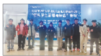
人工智能学院“安恒班”成员参加2025年浙江省职业院校技能大赛荣获金奖

更深层的变革在于专业布局的前瞻性。浙建院主动拥抱低空经济、数字经济等新赛道，开设无人机测绘技术、物联网应用技术等新兴专业。在管理与信息学院，党员师生团队基于AI技术研发的“数智守护”系统斩获省级大奖；与安恒信息共建的“安恒班”，让学生实战技能优秀率提升超35%。从智慧工地到城市生命线监测，从大数据分