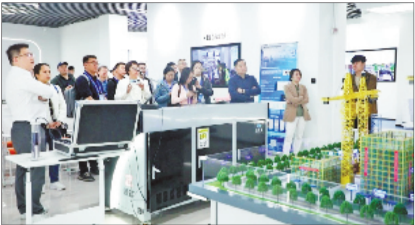
智能建造专业实训环境(浙里建·未来建造中心)

2025年，学校不仅成功立项国家级高水平专业群1个、省级2个，更将目光瞄准产业最前沿，智能建造技术、智慧城市管理技术两个专业获批工信部产教融合合作建设试点。这并非简单的名称更迭，而是深层次的要素要素革命。近年来，学校坚决淘汰与行业脱节的落后课程，新增智能检测、智能施工