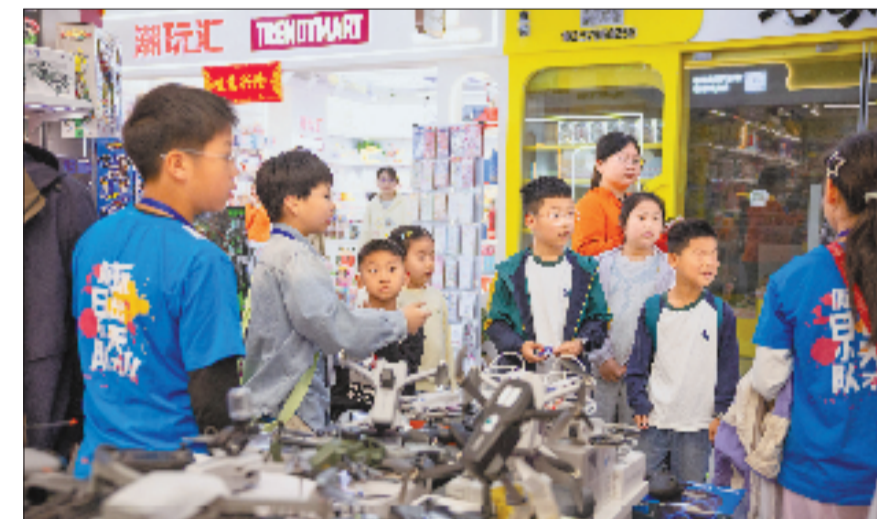
5月1日，来自全国各地的中小学生在家长或老师带领下，来到义乌国际商贸城开展亲子游。