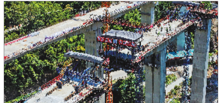
5月1日，工人们在文青高速高架桥上施工。这条高速公路建成后，文成至青田的车程将从90分钟缩短至35分钟。