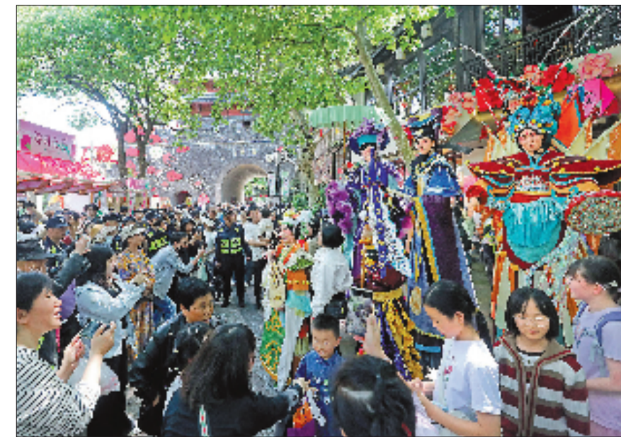
5月1日，杭州清河坊历史文化街区，《京韵·丝路长歌》巡游将高跷艺术与京剧相融，让老街焕发国潮新活力。