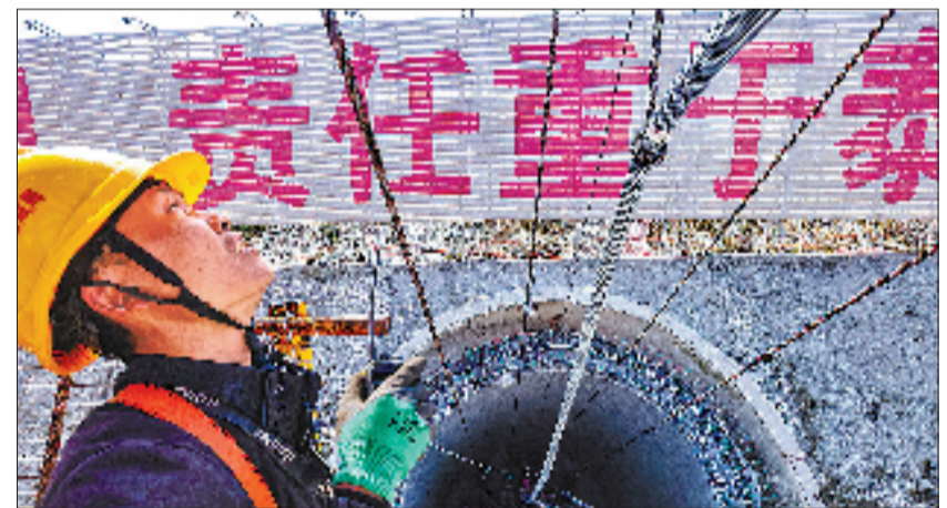
5月1日，舟山双屿门特大桥主缆架设完成，全体建设者以硬核实绩向劳动节献上一份沉甸甸的工程厚礼。