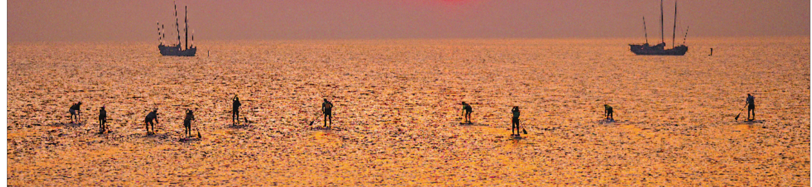
5月1日，桨板爱好者迎着朝霞在太湖踏浪前行，享受水上运动的惬意与活力。