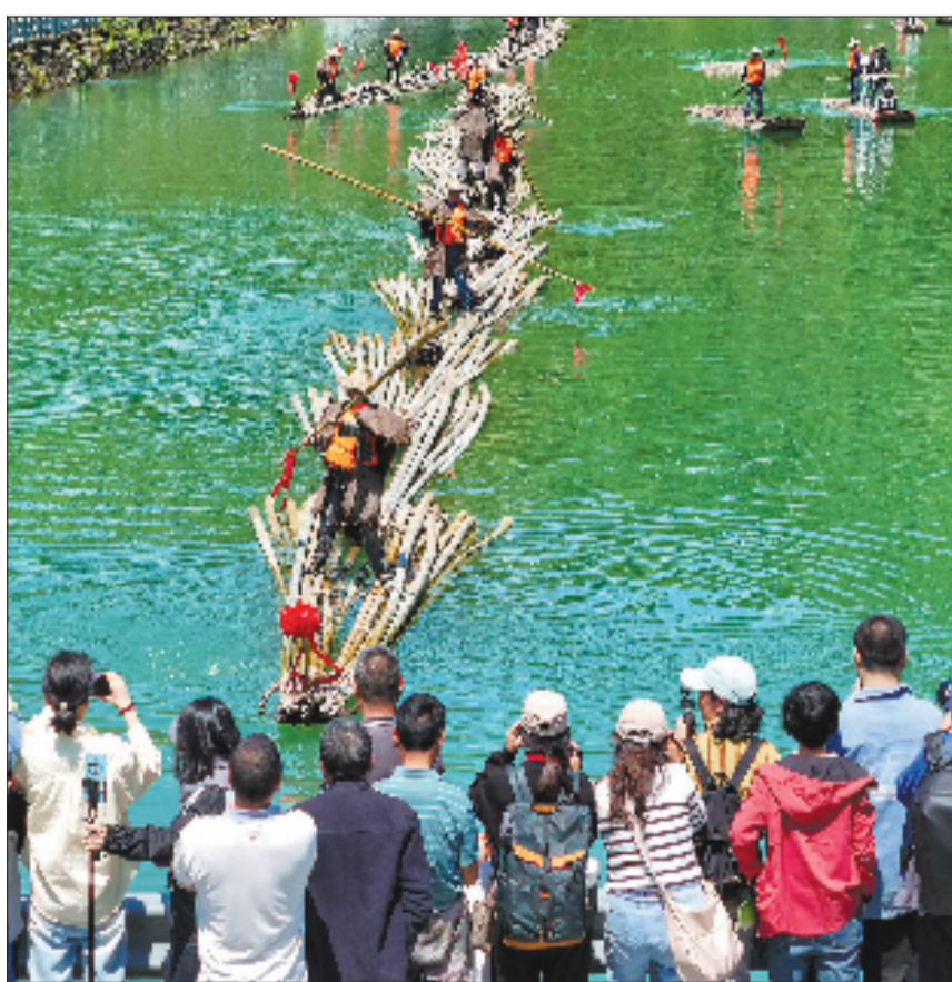
5月1日，安吉县杭垓镇和村村在溪流上放竹筏，再现半个多世纪前百姓水路撑运毛竹出山的场景，当地将乡土记忆打造成了乡村文旅特色体验项目。