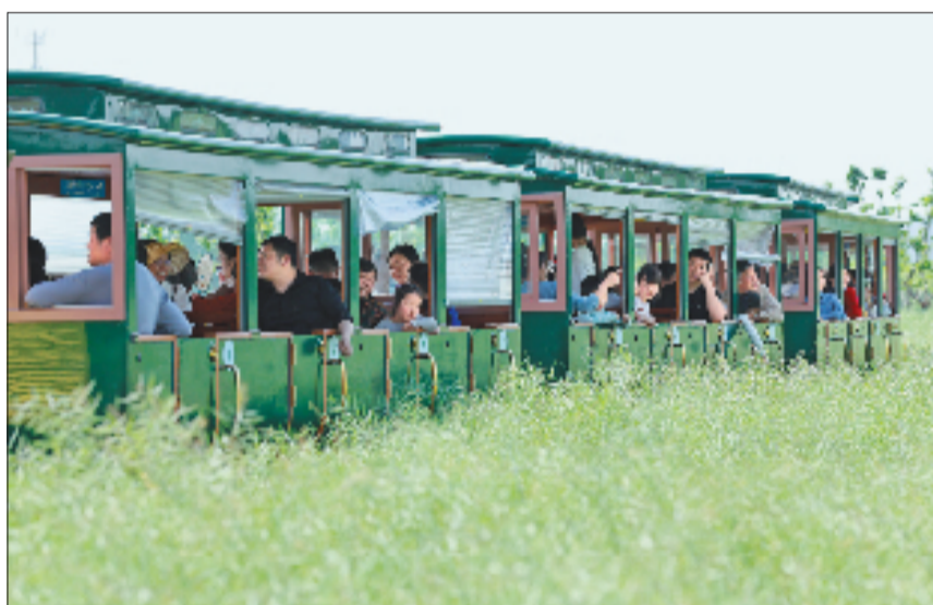
5月1日，杭州市钱塘区河庄街道“钱塘号”“田城汇号”田园小火车启动试运行，串联起生态田园与文旅节点，成为钱塘文旅新打卡点。