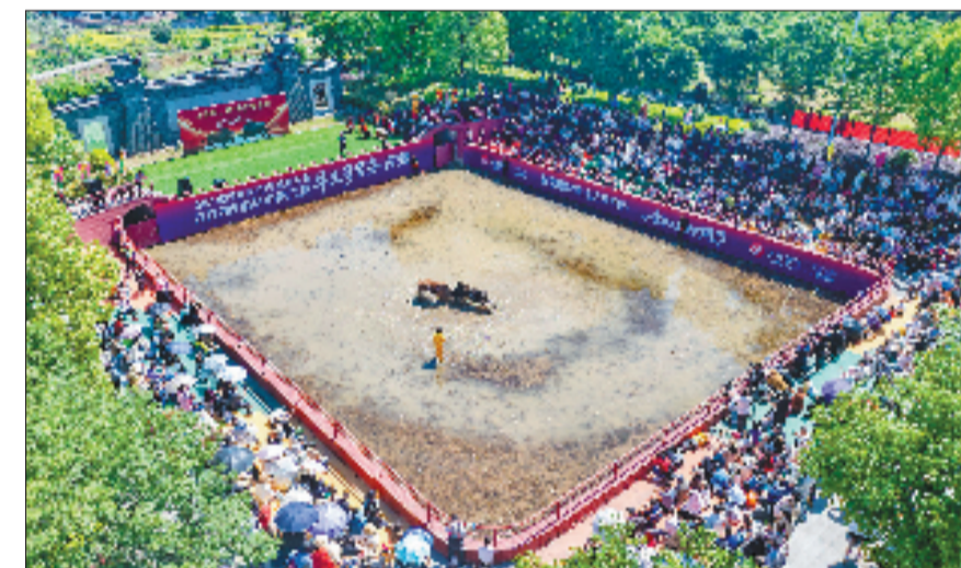
5月1日，金华市婺城区雅畈镇汉灶村，传承千年的金华斗牛民俗活动吸引了众多游客前来观看。