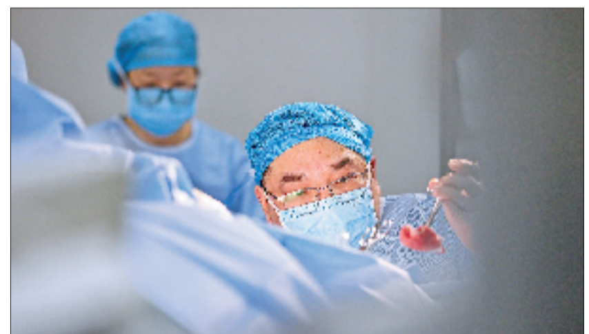
5月1日，嘉兴市南湖区，海警医院医护人员在岗位上守护患者健康。