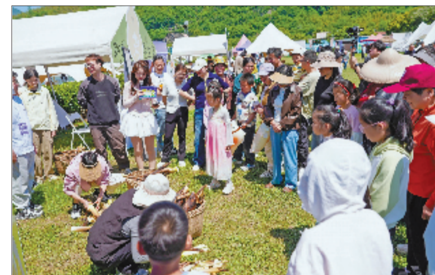
5月1日，绍兴市上虞区陈溪乡露营季在石笋山烧烤露营基地、竹趣园开幕。