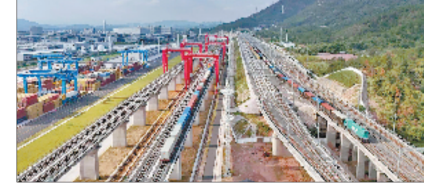
义乌(苏溪)国际枢纽港

一轨飞驰通浙中,丝路潮涌看义乌。4月26日上午,金义东市域轨道交通义乌高铁站试乘、中铁快运签约暨“金华畅行中心”义乌高铁站揭牌活动顺利举行,身披“有情有义 世界义乌”涂装的列车准点发车,标志着金华义乌综合交通枢纽建设再添标志性成果,浙中城市群一体化发展迈入新阶段。这不仅是一次简单的线路试跑,更是义乌立足世界小商品之都定位、持续做强国际性综合交通枢纽港站的生动注脚。近年来,义乌以敢为人先拓通道、以无中生有强枢纽、以点石成金优服务、以实干担当惠民生,用大枢纽、大通道、大网络、大服务支撑世界小商品之都发展,为浙江打造高水平交通强省、服务国家“双循环”战略提供硬核支撑。