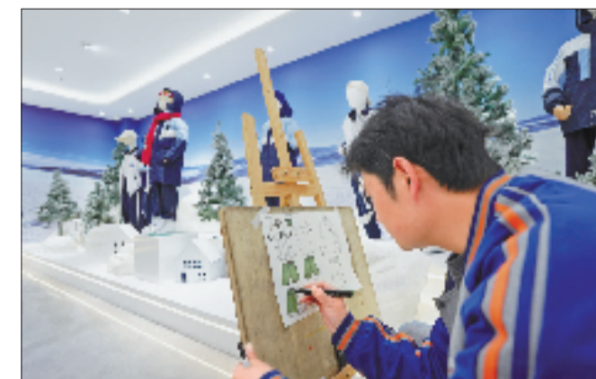
在童装企业的设计室内,设计师正在绘制新款童装草图。