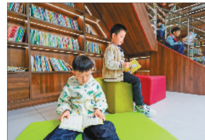
4月21日,诸暨市暨阳街道乐龄中心图书角,孩子们挑选自己喜爱的书籍阅读。