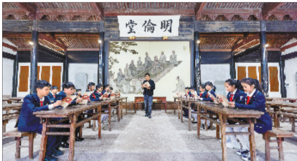
4月24日,宁波市江北区慈城镇中城小学的同学走进慈城孔庙开展沉浸式国学经典阅读活动。