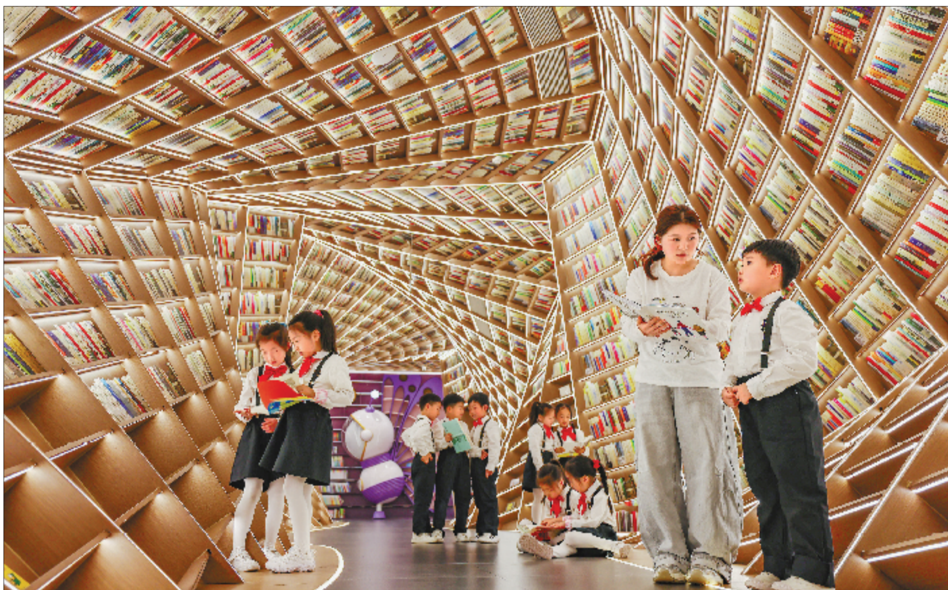
4月22日,永康市民主小学组织师生走进大司巷特色文化街区钟书阁,开展沉浸式阅读实践活动。