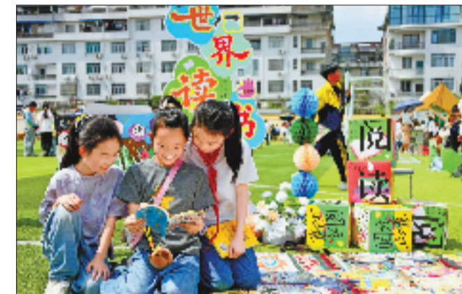
4月20日,仙居县第七小学举办校园阅读节“淘书乐”活动,学生将自己闲置的图书带进校园,通过交换图书、阅读图书等方式,培养良好阅读习惯。

人间四月,春光正好。4月20日至26日,2026年“全民阅读活动周”如约而至。全省各地充分利用公共文化设施,结合本地区文化资源特色,推出便民措施,满足群众高质量阅读需求,延伸阅读服务触角,打通阅读服务“最后一公里”。