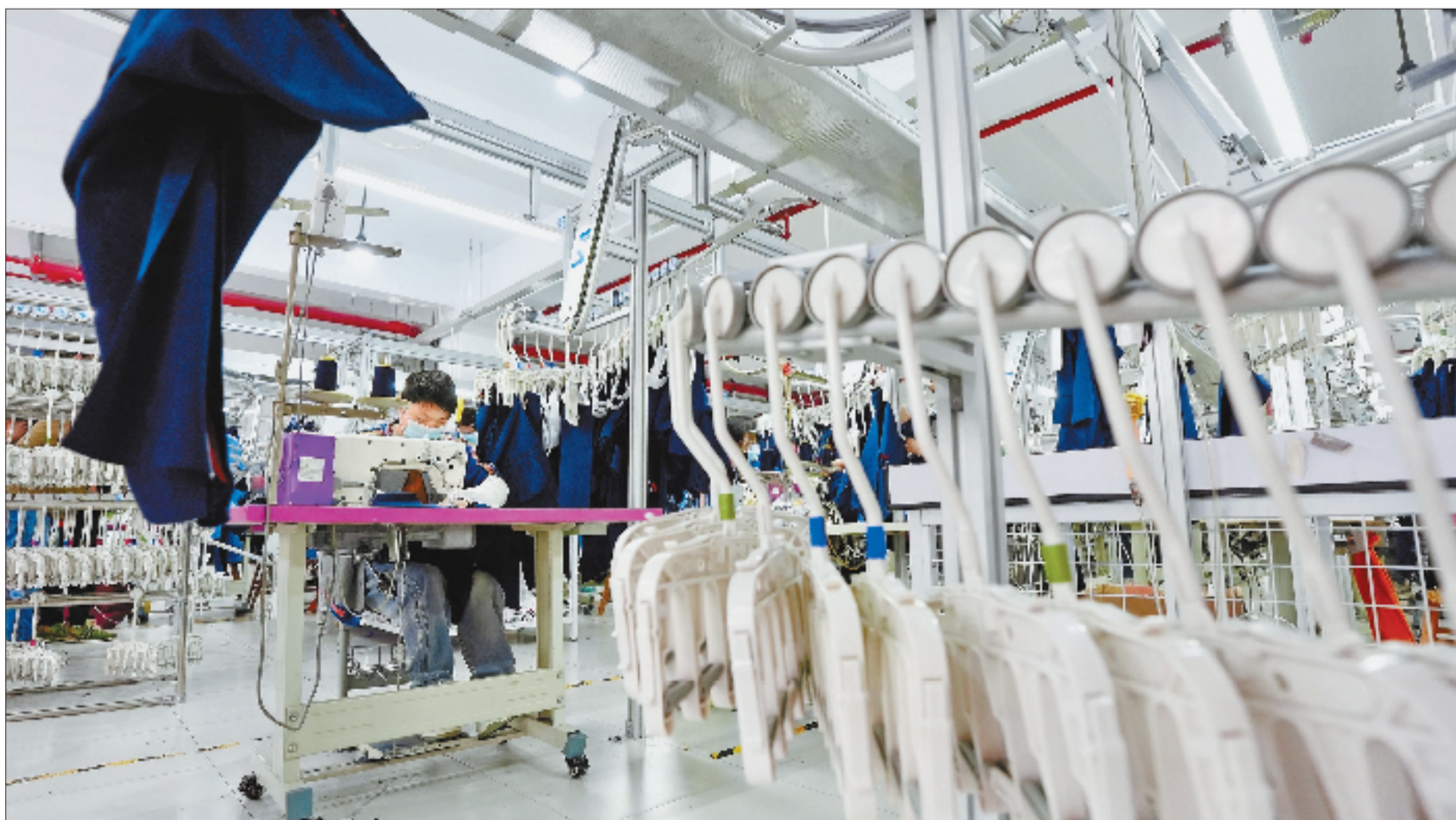
童装智能工厂的自动吊挂系统使校服日产量大幅提高。