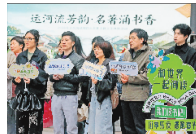
4月23日,在杭州古城墙陈列馆广场,以“运河流芳韵·名著诵书香”为主题的全民阅读周文化体验活动开幕。