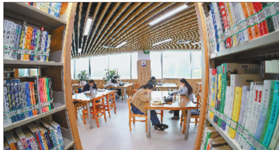
4月23日,读者在温州市图书馆内静心品读,享受阅读时光。