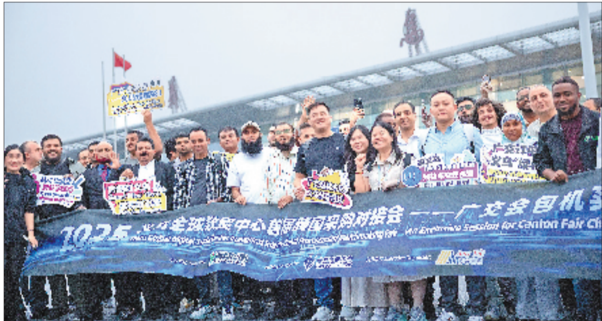
100余位来自欧洲、中东等地区的境外专业采购商包机抵达义乌，参加2025义乌全球数贸中心首届跨国采购对接会（资料照片）。

大家表示，将以正确政绩观引领正确发展观，改革创新、真抓实干、久久为功，以一张蓝图绘到底的定力，创造