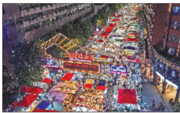
义乌市稠城街道三挺路夜市人潮涌动。该夜市不仅为城市增添浓浓烟火气，更带动了周边数千人就业（资料照片）。