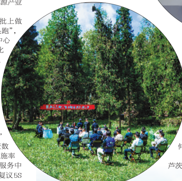
法治与绿水青山同频共振

大胆闯，大胆试。法治护航营商环境，桐庐勇当“探路者”：建成全国首个县级知识产权保护中心，落地全省首家法治化营商环境专业法庭。不仅如此，桐庐还成为杭州市唯一在专利侵权纠纷行政裁决规范化建设、知识产权纠纷快速处理两大领域“双国家级”试点县。