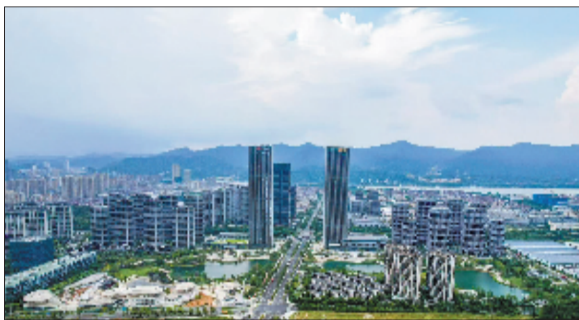
桐庐打造“5541X”先进制造业集群