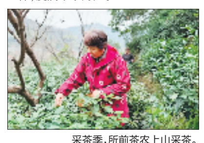
采茶季,所前茶农上山采茶。

中心下辖8个服务站,组建17支家庭医生团队,构建起覆盖全域的“15分钟医疗服务圈”,让优质服务像茶香一样,浸润千家万户。