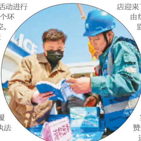
为港口经营企业提供服务与流程一站式指导服务

这份踏实感，源于舟山推出的“预约式”涉企指导服务。全市集成上架“预约式”指导服务主题场景46个，形成涵盖407项事项的“企业体检清单”，开展“事前指导、事中守法、事后整改”全周期服务，有效激活企业主动预约、政府精准指导的服务闭环。此外，舟山推出“首