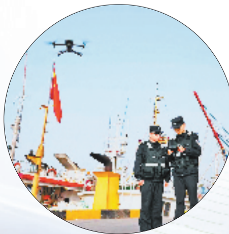
嵊泗公安用无人机进行智慧巡航