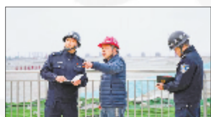
嵊泗公安在项目工地开展安全排查

在地面防控网基础上，嵊泗公安推出“空地一体”防控模式。夜幕降临，一架闪烁着红蓝警灯的无人机悄然升空，对重点企业周边区域进行智慧巡航。