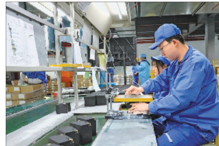
4月8日,在位于湖州德清的天丰电源生产车间,工人正在生产HJ13L-FPZ高性能启动锂电池。