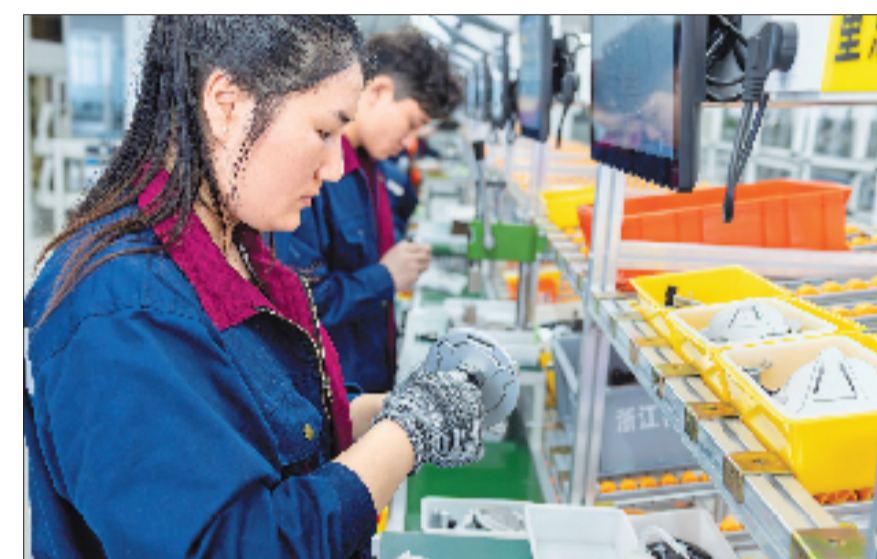
4月10日,位于温州瑞安的浙江雷牌机件有限公司组装车间,工人们正在生产为张雪机车配套的油箱锁、坐垫锁等。