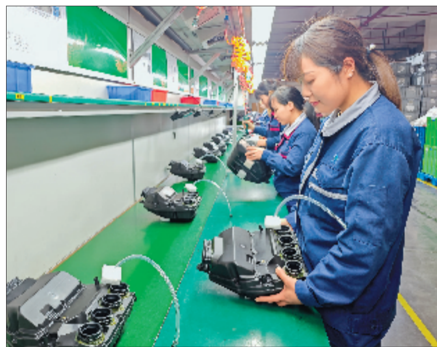
4月8日,台州恒勃控股股份有限公司重庆厂区,总装5线正在组装生产为张雪机车配套的摩托车空滤器。

中国摩托车制造商张雪机车在世界超级摩托车锦标赛葡萄牙站斩获双冠后,其背后一张覆盖浙江多地、贯穿全产业链的网络浮出水面。近日,本报记者走进浙企生产一线,深度挖掘世界冠军赛车上的浙江制造,看中国制造如何在全球顶级赛场实现突破。 作为国内新能源领域重点企业,湖州天丰电源自2024年张雪机车成立之初,就成为其独家启动锂电池供应商,本次配套的第七代高性能锂电池,重量约1.3公斤,较传统铅酸电池减重40%,有效提升赛车操控性与加速表现;绍兴新昌的万丰奥特控股集团为“张雪机车”500RR、500F、820RR等车型配套铝合金轮毂、摆臂与车架,全方位助力性能升级,从赛道夺冠到量产进阶,万丰的轻量化技术正系统性地提升“张雪机车”的产品实力;张雪机车的多款摩托车上都有赛福制动的