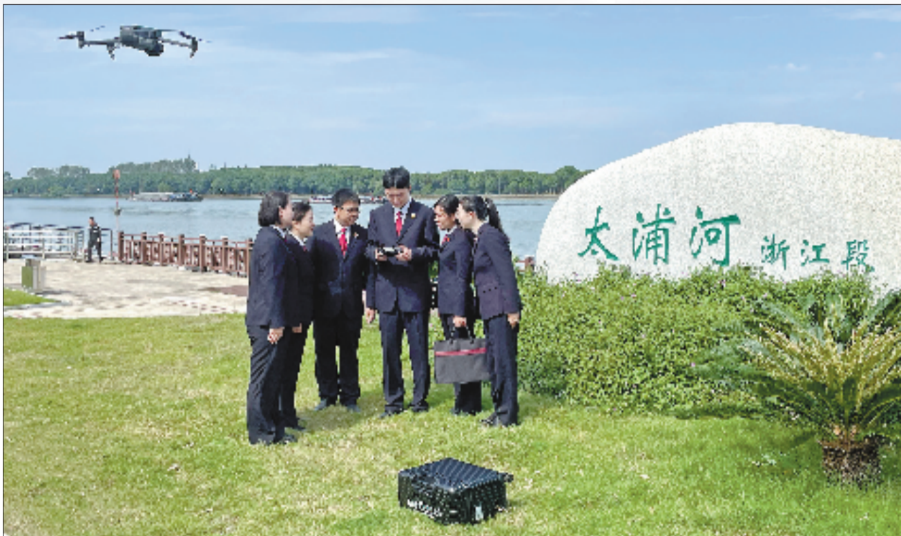
检察官办理太浦河流域公益诉讼案件。

2023年10月,江苏某电工公司向太浦河排放废液,污染波及沪苏浙三地。嘉善县检察院提供的卫星影像成了定罪关键。最终,违法者被追究刑责并