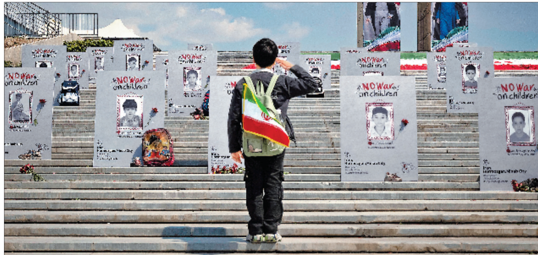
当地时间4月1日,伊朗德黑兰,一名伊朗学童在阿巴斯阿巴德文化旅游区举行的伊斯兰共和国升旗仪式上敬礼,他面前摆放的是在美以空袭中遇难的伊朗儿童肖像。

今年1月3日,美军对委内瑞拉发动大规模军事打击,强行控制委总统马杜罗及其妻子并将他们带到美国。时任副总统罗德里格斯随后出任代总统。近日,委内瑞拉和美国相继恢复驻对方国家的大使馆。