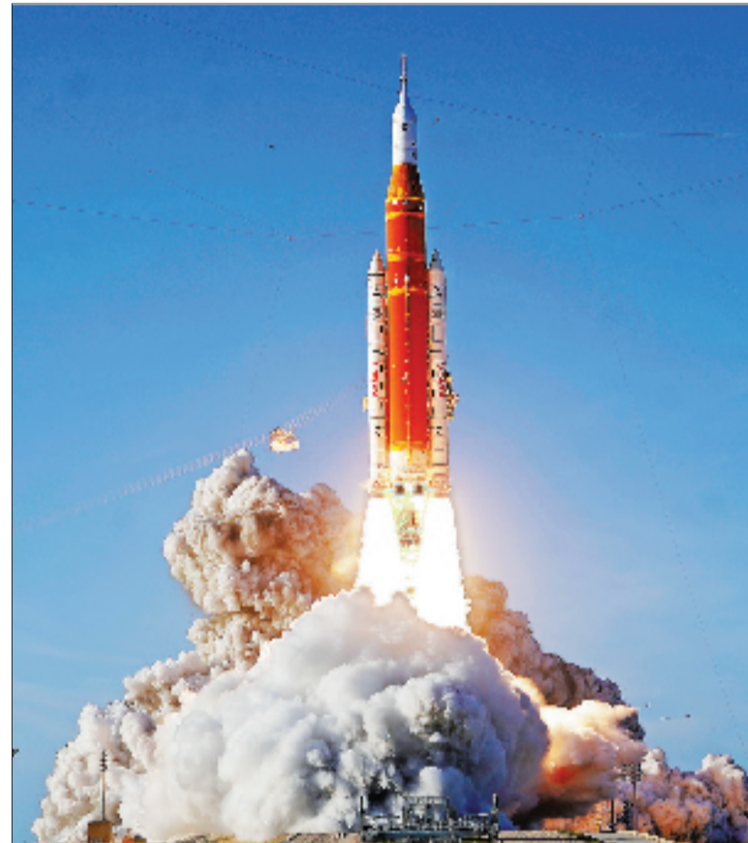
4月1日,美国航空航天局新一代登月火箭“太空发射系统”从佛罗里达州肯尼迪航天中心发射升空,执行“阿耳忒弥斯2号”载人绕月飞行测试任务。

此次任务原计划于2月实施,但因两次综合演练中出现技术问题,发射时间一再推迟。美国于2019年宣布“阿耳忒弥斯”登月计划,并于2022年11月完成“阿耳忒弥斯1号”无人绕月飞行测试任务。“阿耳忒弥斯2号”是该计划下的首次载人任务,也是自1972年美国阿波罗17号登月任务结束后美国首次载人飞向月球。