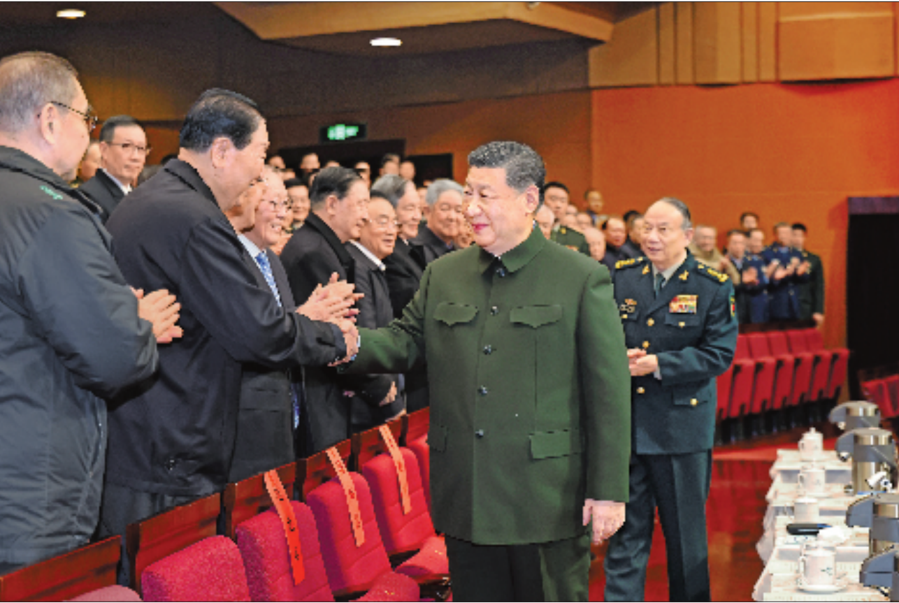
2月6日下午，中央军委慰问驻京部队老干部迎新春文艺演出在中国剧院举行。中共中央总书记、国家主席、中央军委主席习近平观看演出，向在座的军队老同志，向全军离退休老干部，致以节日问候和新春祝福。

“旗帜领航，团结奋斗向前方！熔炉淬火，越锻造越坚强！”混声合唱《永远的荣光》以铿锵旋律拉开演出序幕。演出贯穿整场锻造焕新风、攻坚克难冲锋向百年的鲜明主题，突出展现政治建军新风貌、现代化建设新进展、备战打仗新成效，抒发全军官兵坚定维护核心、坚决听从指挥的共同心声。器乐与合唱《钢多气更盛》、表演唱《战争就在下一秒》聚焦部队练兵备战火热实践，生动反映官兵枕戈待旦、敢打必胜的责任担当。情景演唱《七律·长