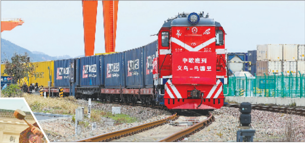
中欧班列(义乌——马德里)