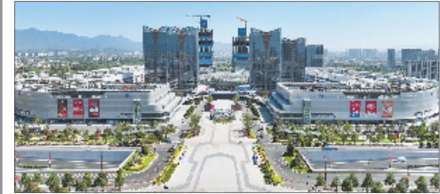
义乌第六代市场航拍图

1982年,义乌率先开放小商品市场,这一勇敢抉择,开启了这座县城面向世界的征程。六易其址、十三次扩建、六代跃迁——市场形态的每一次蝶