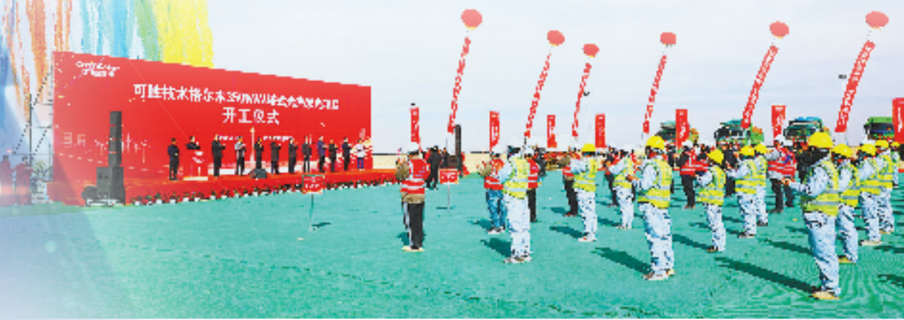
浙江可胜技术格尔木 350MW 塔式光热发电项目开工