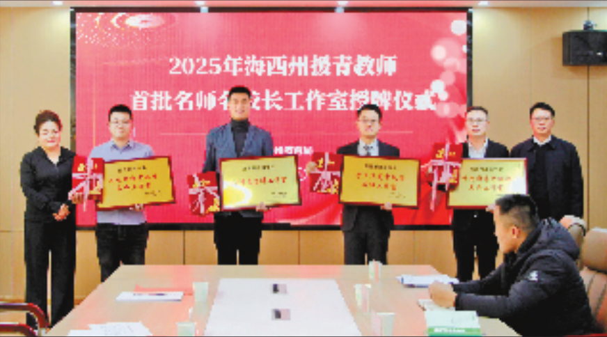
海西州援青教师首批名师校长工作室授牌

“对口支援是党中央着眼区域协调发展、民族团结、共同富裕作出的重大战略决策。广大浙商扎根高原、投资奉献，已成为浙江援青最倚重的力量、最宝贵的资源、最闪亮的名片。”指挥部主要负责人的评价，既是对过往成绩的肯定，更是对未来合作的期许。如今，浙商浙企正以创新活力与实干精神，与当地共谱