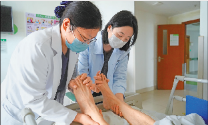
记者(右)为患者做踝泵运动。