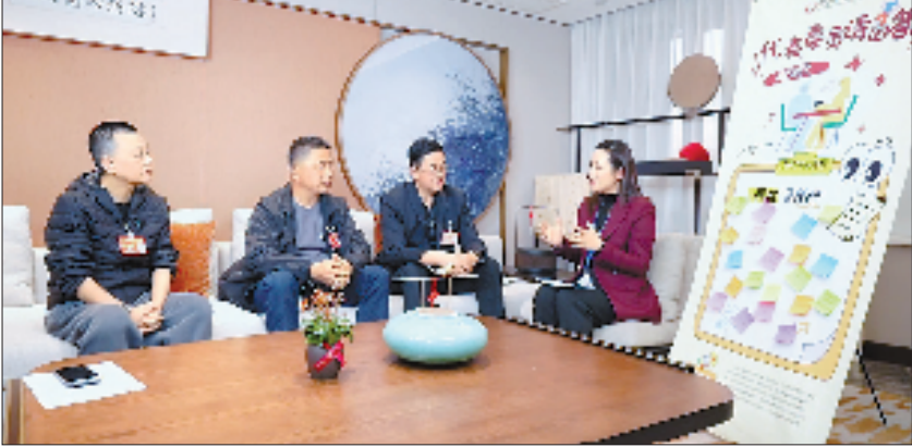
1月13日傍晚,记者访谈三位省人大代表。