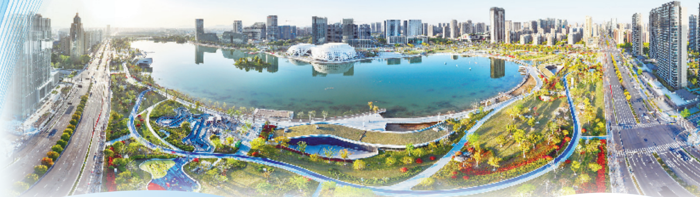
钱塘(新)区高水平打造大都市战略门户、现代化一流新区

迈入“十五五”，钱塘实干至上、奋勇争先，以推进高质量发展的务实行动，因地制宜发展新质生产力，推动高质量发展建设共同富裕示范区时代样板取得决定性进展，高水平打造大都市战略门户、现代化一流新区。