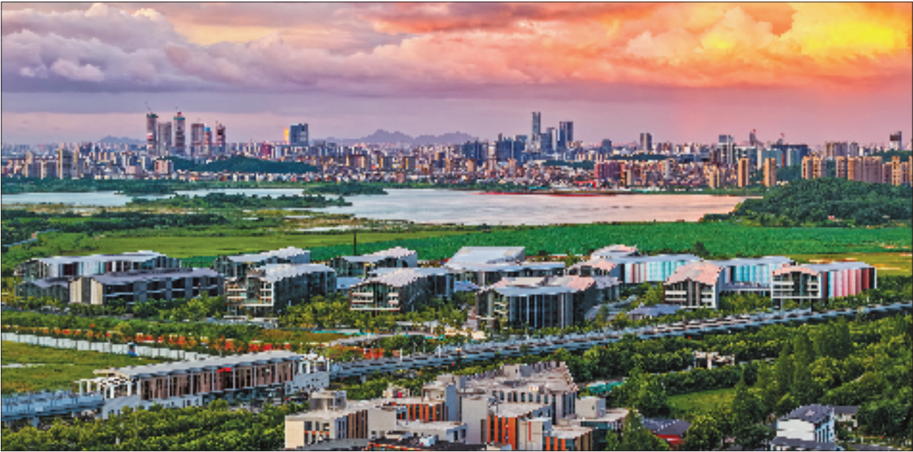
从南湖眺望杭州城市新中心中轴线风光。

记者: 城市更新是城市内涵式发展的重要抓手。您提出,要改变过去政府主导城市更新的模式,更好地激发居民