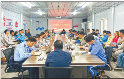
金塘新材料园区综治中心调解矛盾

从部门协同破壁垒到党建引领聚合力，从数字赋能提效能到创新调解解民忧，从智慧防控护平安到精准服务暖人心，金塘新材料园区综治中心不仅有效破解了海岛公共服务“最后一公里”的难题，更打造了基层治理创新的“金塘样本”，为舟山大宗商品全产业链高质量发展注入了强劲持久动能。