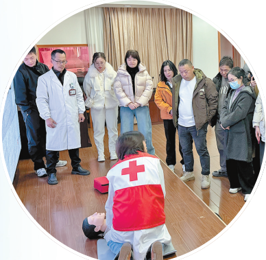
普陀山急救侠 培训现场

在“海天佛国”普陀山，这张网以“定点坚守+高效响应”为核心，构筑起稳健可靠的保障体系。洛迦山上的常态化医疗保障点，如同一座生命驿站，守护着每一位登岛的游客。整个景区背后，还有一个高度敏捷的急诊急救系统，不仅保障各大节假日期间的游客平安，还通过主动预警降低意