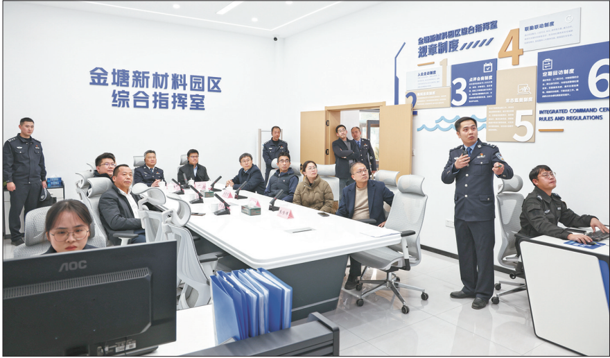
金塘新材料园区综合指挥室

这个项目总投资规模大、建设周期长，自2023年底动工以来已吸引了170余家分包单位，近万名工人参与建设，目前进出工人已经超过8万人次。金塘