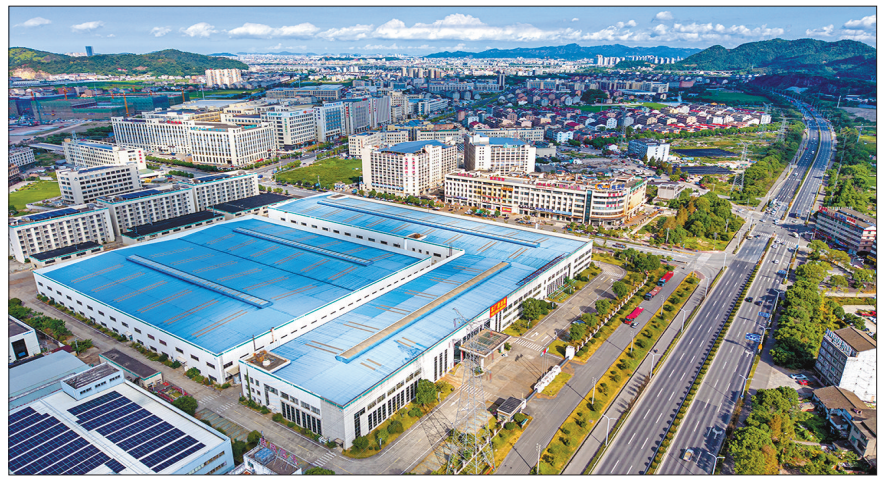
泵与电机千亩产业园

批优质企业扩建项目将迎来关键节点，3个投产、8个结顶、4个开工。面对土地资源的硬约束，大溪坚定选择“向存量要空间、向低效要效益”，推行“低效用地改造5年计划”，已连续2年争取省级中小企业用地指标600余亩，跨省转移用地指标200余亩，解决指标紧张问题。