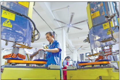
大溪镇的台州正立电机有限公司车间里，工人正在进行电机嵌线作业。

大溪镇正在经历一场深刻的产业跃迁，庞大的产业基底也面临着“成长”的烦恼。我们半小时车程内就能完成大部分配套。温岭市经信局相关负责人坦言，但产业链上仍有“关键断点”，例如永磁电机的控制器本土化率尚不足30%，核心磁性材料长期依赖外购。