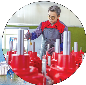
城东街道一企业车间内，工人们铆足干劲赶订单。

视线转向百丈南路，塔吊林立之处，温岭首个“工业上楼”项目——新城智谷一期已然封顶，二期建设正酣。据悉，