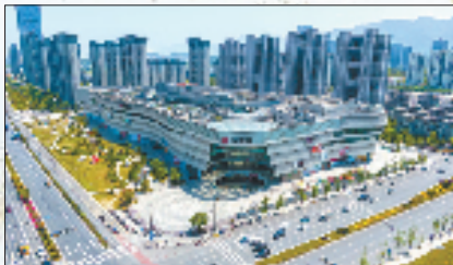
海康机器人智能制造(桐庐)基地项目