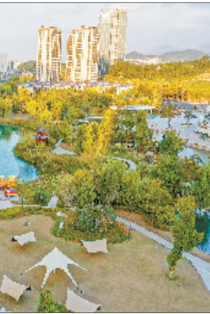
杭州市第一人民医院桐庐医院

有空间。以生态支撑创新,以创新引领产业发展,通达未来城可以走出一条吸引年轻人、吸引人才的新路径。