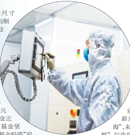
宁波卢米蓝新材料有限公司生产车间