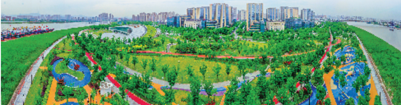
生态宜居的宁波高新区