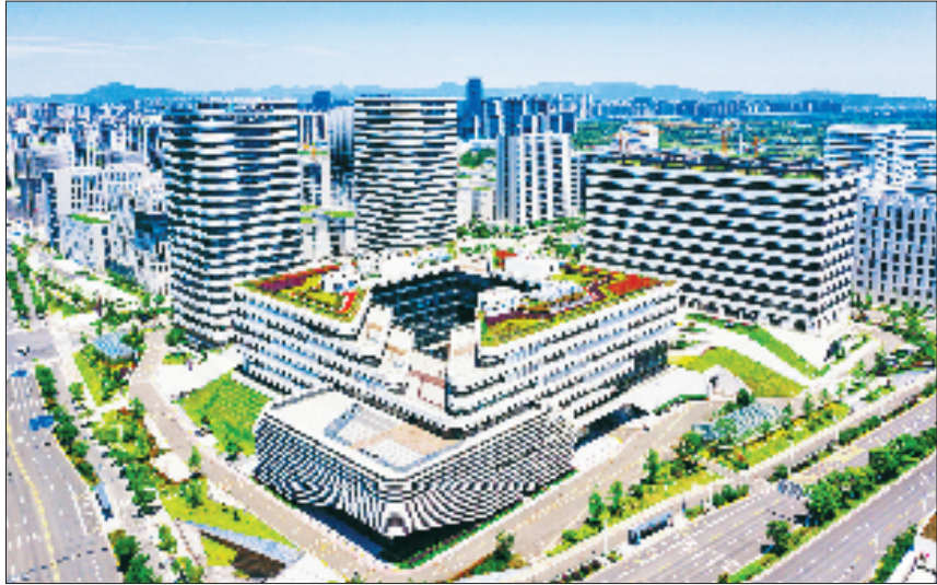
宁波甬江科创协同创新中心

当前,宁波高新区已经形成“南数创、北材料”的集群化发展格局。围绕数字经济、新材料两大重点产业方向,宁波高新区通过“链主引领+平台支撑+精准