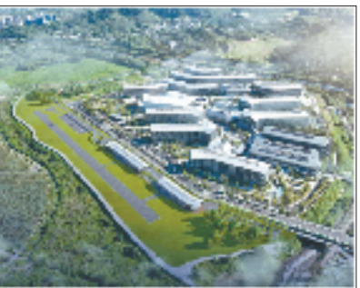
杭州余杭民用无人机试飞运行基地效果图

余杭区交通运输局相关负责人表示，接下来，将依托民用无人机试飞运行基地，持续放大低空经济产业辐射力，进一步优化低空飞行服务保障体系，拓展无人机在物流配送、城市治理等领域的规模化应用，完善低空经济产业生态，为培育新质生产力、构建现代化产业体系注入强劲动能。