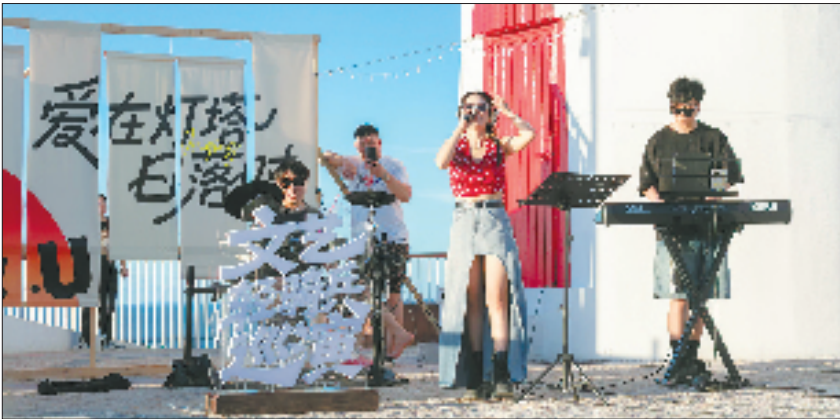
“爱在灯塔”音乐会文艺轻骑兵巡演

当前，金清镇以文艺轻骑兵为纽带，串联起渔港、非遗、美食等资源，打造“文化体验+消费升级”新模式，实现从“文化名片”到“共富引擎”的产业跃升。前不久，“小网海鲜千人宴”活动中，游客既能品尝现捞现烹的黄琅青蟹、沙蒜豆面，又能参与非遗草编、海鲜拓印等互动体验，形成“吃、玩、购”一体化。活动期间，现场消费超