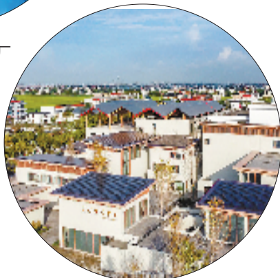
梅林美好生活中心