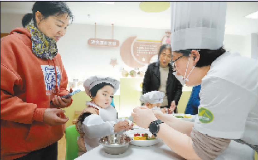
杭州市婴幼儿照护服务实训基地营养膳食厨房

此外，基地还设有专为3岁以下婴幼儿提供照护服务的托育园样板间：乳儿班配备爬爬垫与观察镜，托小班、托大班科学分区，一日生活流程上墙；户外模拟区保障充足的运动空间；保健观察室负责健康管理。其中，乳儿班重点强化爬行训练和自我认知发展，托小班、托大班设置角色扮演区、建构区、益智区、绘本区等功能区，实现养育照护与早期发展有机融合。