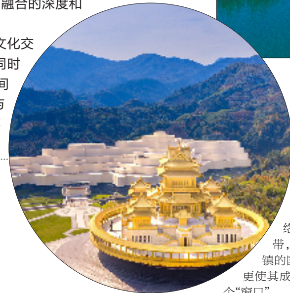
接待游客近700万人次，预计全年将突破800万人次。

去年第六届世界佛教论坛的举办，则进一步提升了溪口在国际上的知名度和影响力。今年1至10月，当地已