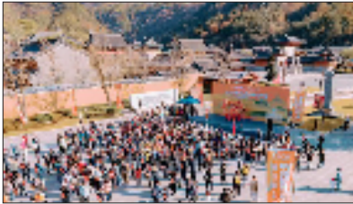
2025雪窦山中韩登山大会