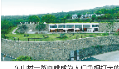
东山村一览咖啡成为人们争相打卡的网红店