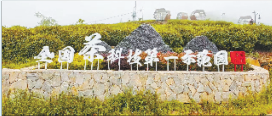
仙岩镇以茶为媒富民强村

“十四五”期间，仙岩镇立足实际，创新构建以“岩自当先”为统领的基层党建作品牌，通过多元化的形式激发先锋引领力，助力乡村振兴。目前，仙岩镇已培育星级“共富工坊”10个，党建优势转