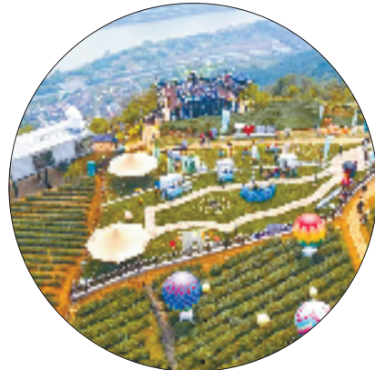
“潮启仙岩 云上舜皇” 嵊州市春茶季系列活动

“十五五”期间，人民生活更加幸福美好仍是经济社会发展的主要目标之一，仙岩镇将继续聚焦基建提质、普惠共享，努力绘就百姓生活幸福图景，为乡村振兴提供可复制的“仙岩样本”。