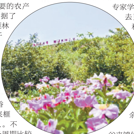
谷来镇推广榧药共植

连绵的香榧林，描绘了谷来镇的生态底色；满树的香榧果，为勤劳的谷来榧农带来了经济收入。不过，由于香榧的生长周期比较长，而且习性相对“独立”，导致