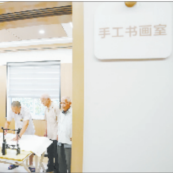
老人在华丰村养老驿站书法

龄、失能等六类特殊老人均已纳入“基本服务清单”,月探访关爱率达到100%。 智慧化赋能让这种守护更有温度、更具效率。海宁市打造的“e护康”居家智慧医养服务项目,将“互联网+医养结合”与家庭医生签约、家庭病床等服务有机结合,解决居家高龄、失能、残疾老年人等重点人群的高频医护服务需求。 目前,海宁市已有3万多名重点对象、198支家庭医生签约团队、972名医护人员纳入平台管理,平均每月服务