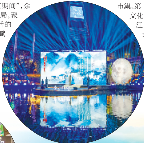
“吾心自有光明月”中秋诗会