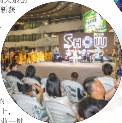
“show余姚 艺起来”街头演艺

今天的余姚，“阳明故里”“文献名邦”“红色革命根据地”的精神与文化，依旧生生不息。文化传承，这场“接力长跑”还在继续。