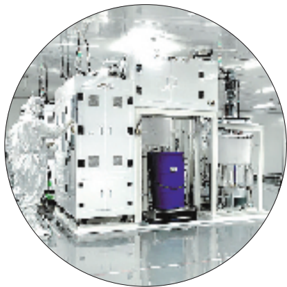
润平电子生产车间

相关数据显示，今年前三季度，余姚多条产业链表现亮眼：余姚智能光伏产业链实现增加值1.81亿元，同比增长148.4%；演艺产品产业链实现增加值6.99亿元，同比增长22.7%。两条产业链