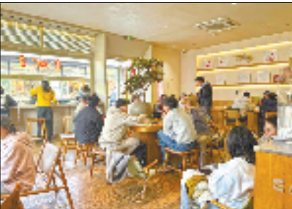
数字游民在玉鸟集小聚

从国际创客到数字游民，从AI开发者到文艺青年，这里不只留住了人，更激活了整片区域的创新活力。未来，余杭还将在中轴线上布局更多高品质、有温度的活力街区，让每个人都能在这片热土上参与创造、共同守护，将这座未来之城打造成既充满无限机遇，又让人心安归处的理想家园。