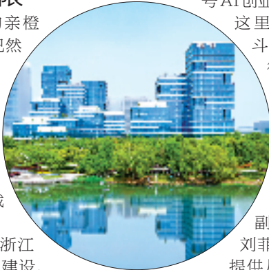
余杭区牵手阿里巴巴打造“模域空间”

今年9月，为贯彻落实浙江省“415X”先进制造业集群建设、杭州市“296X”先进制造业集群建设部署要求，余杭聚焦垂直领域的