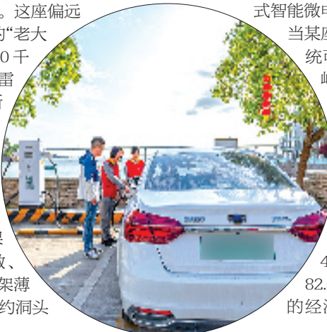
洞头区播网畚村，海霞电力服务队队员帮助游客给新能源车充电。

成效是显著的。现代智慧配电网的“迭代升级”，推动洞头全域故障自愈水平从44%大幅提升至82.5%，单次停电造成的经济损失减少超100万元。同时，全区分布式光伏装机总容量增长超过4