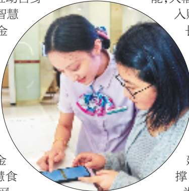
农行工作人员指导客户在手机上使用“智慧食堂”。