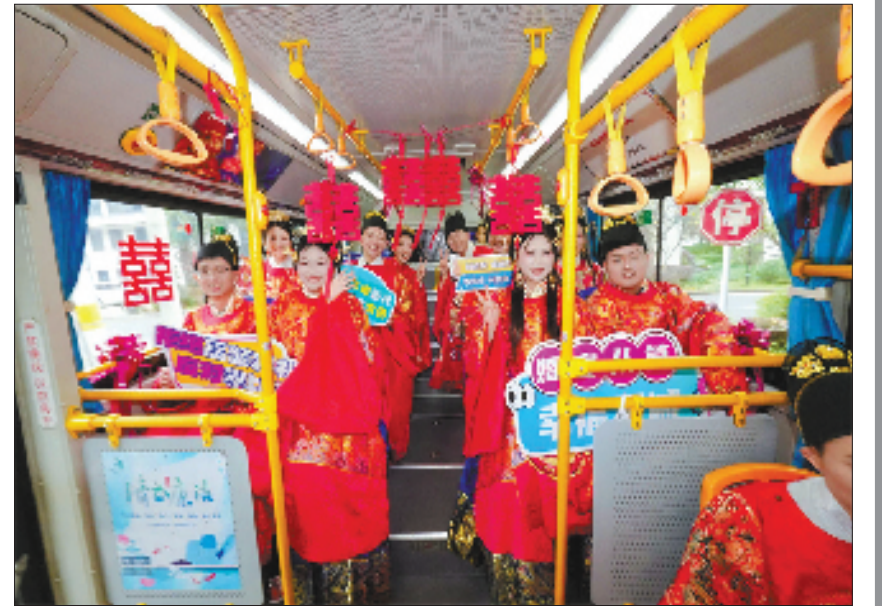
新人选择公交接亲形式,演绎新时代婚嫁新风尚。

独特的方式,打破宴席的“奢华定律”,重构“家宴”的价值坐标。曾经攀比成风的“面子宴”,正逐渐被富有创意、充满温情的“文明席”所取代。从硬件支撑到群众自觉,从制度约束到文化浸润,许村镇以系统化的思维和务实举措,推动移风易俗落地生根、开花结果,不仅重塑了乡风民风,也为探索基层治理现代化提供了可复制、可推广的“许村样本”。