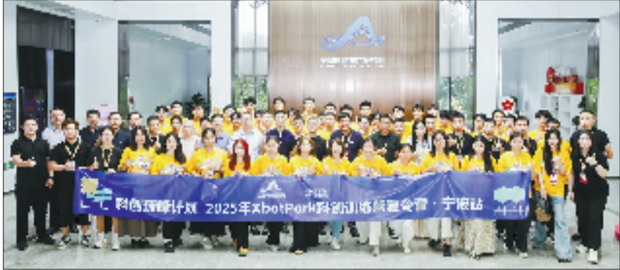
智能技术研究院夏令营

一栋栋老旧楼宇“焕发新生”，成为海曙推动“全域焕新”的生动缩影，城市“烟火气”日益浓郁。以江夏街道为例，宁波江夏柿集文化产业发展有限公司正携手街道，推动中心城区老旧楼宇实现全面革新与功能升级。