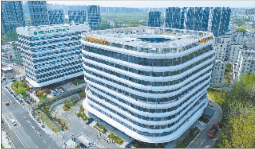
海曙区美好生活中心

伐坚定。服务业增加值占地区生产总值比重提升至72.4%，生产性服务业占服务业比重达56.5%，成功创建2个省级现代服务业创新发展区，并获评全国快递业与制造业融合发展试点。同时，数字经济核心产业增加值占GDP比重5.3%，新型工业化扎实推进。