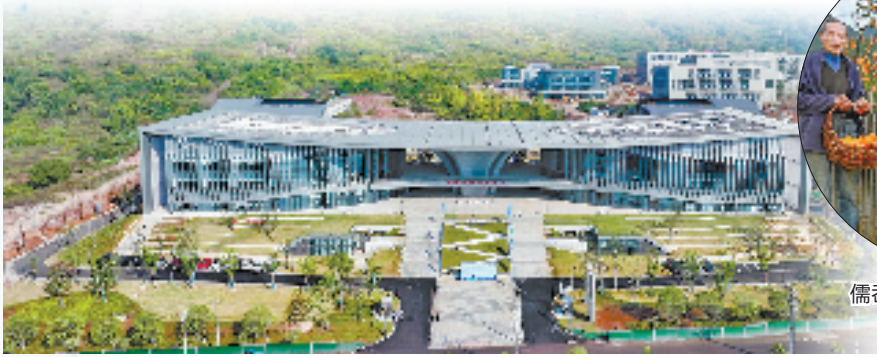
新昌高创智造科技园