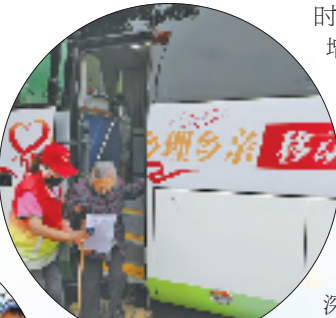
移动医院进村，为群众提供家门口医疗服务。