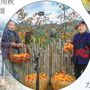
儒岙镇桃山村柿子直播