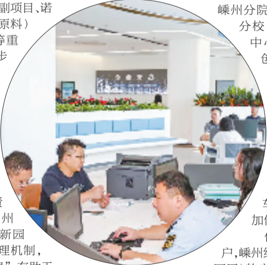
企业综合服务中心里,“代办员”开展助企服务。

以产促富、以城聚富、以人创富。在这江南一隅,火热的创新创业氛围与安居乐业的和谐乐章正交织回响,共同迎接“十五五”的到来,谱写“富乐嵊州”建设新篇章。