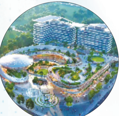
未来工厂邻里中心效果图

化、规模化的现代领军企业,励志的“贝贝故事”,既是坚韧专注、创新合作等新时代浙商精神的生动写照,更是“十四五”时期,嵊州经济开发区(高新园区)坚持“两山”理念,推动传统产业转型升级,积极布局现代绿色产业,打造“绿色生态