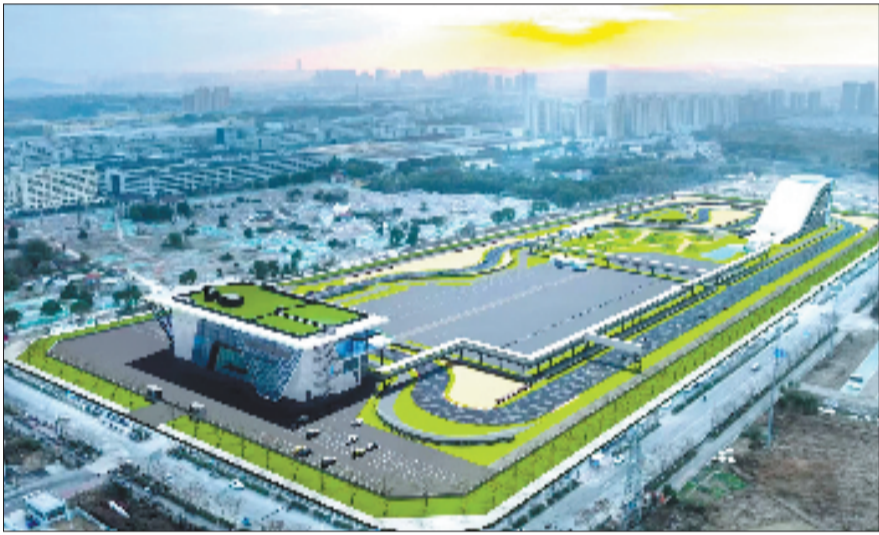
比亚迪新能源汽车文化体验中心项目效果图

“十五五”时期,高质量发展仍是核心主题,嵊州经济开发区(高新园区)将竞逐创新、勇于突破,全力以赴拼经济、抓项目、促发展,为中国式现代化富乐嵊州建设贡献更多力量。