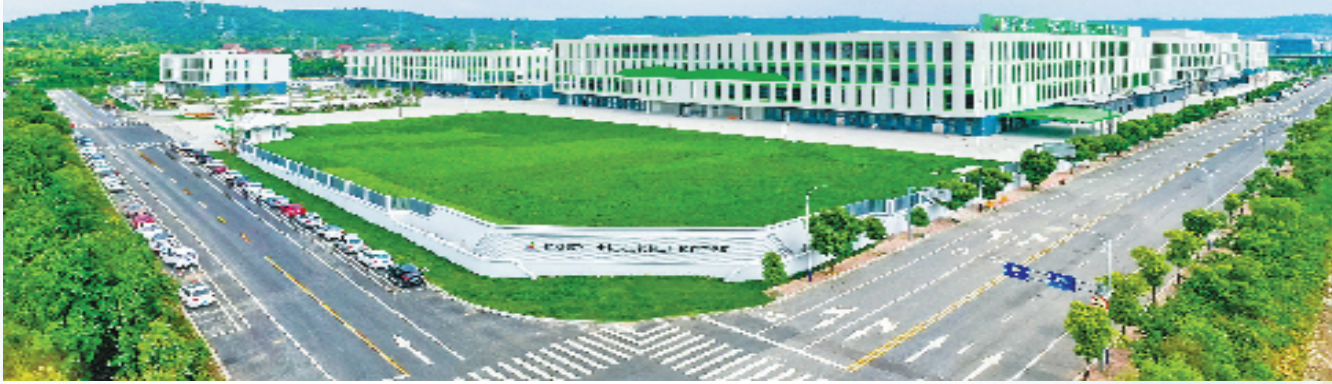
嵊州陌桑高科股份有限公司的全龄人工饲料工厂化养蚕基地

党的二十届四中全会指出,在“十四五”期间,我国经济实力、科技实力、综合国力跃上新台阶,中国式现代化迈出新的坚实步伐。