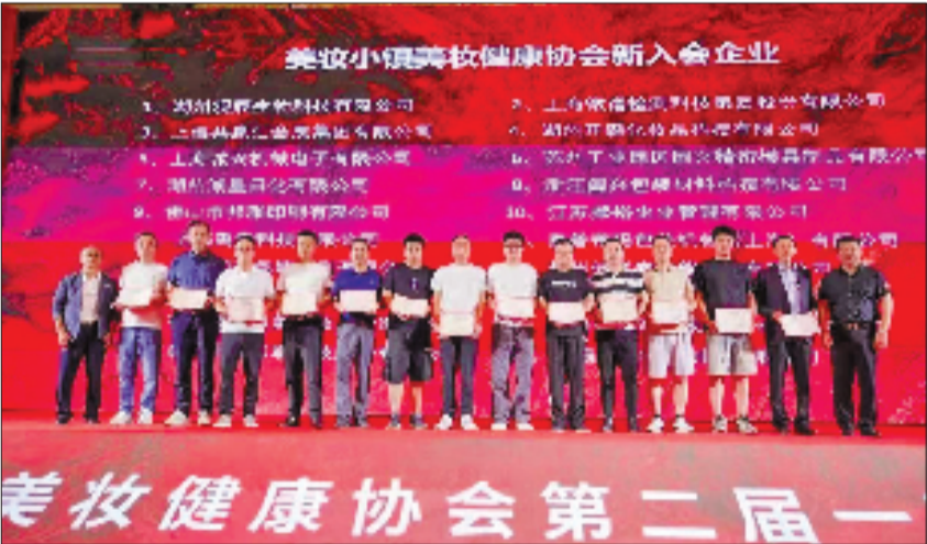
美妆健康协会第二届一次全体会员大会暨成立五周年庆典举行