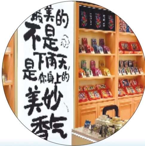
御梵国潮香氛南浔文店

十年淬炼，美丽芳华。从工业的坚实底色中孕育美丽产业，从“引进来”到“培育好”，从单一产业到多元融合，美妆小镇走出了一条独具特色的发展之路。面向未来，埭溪镇正以更加开放的姿态、更加创新的生态，奋力书写中国美丽经济的新篇章。