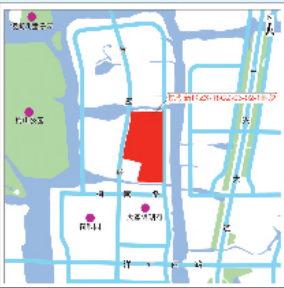
镜湖新区ZX-18CZ-03-02-1地块区位示意图