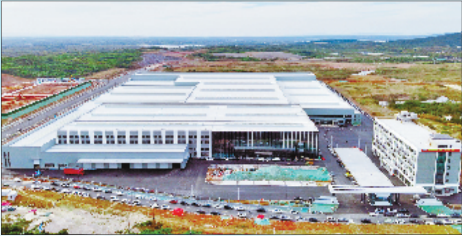
浙江豪斯特新能源汽车零部件项目现场

人才是创新的第一资源。长合区创新“基金+人才+项目”引才模式,专注“投早投小投硬科技”。累计引进南太湖精英计划项目14个、科技人才项目39个,自主培育国家级高层次人才创业人才3人,招引大学生及实用技术人才超3000人。与此同时,湖州市职业教育公共实训基地建成投用,为产业发展提供了坚实的人才支撑。从“招商引资”到“招才引智”,长合区正成为长三角人才创新创业的“强磁场”。