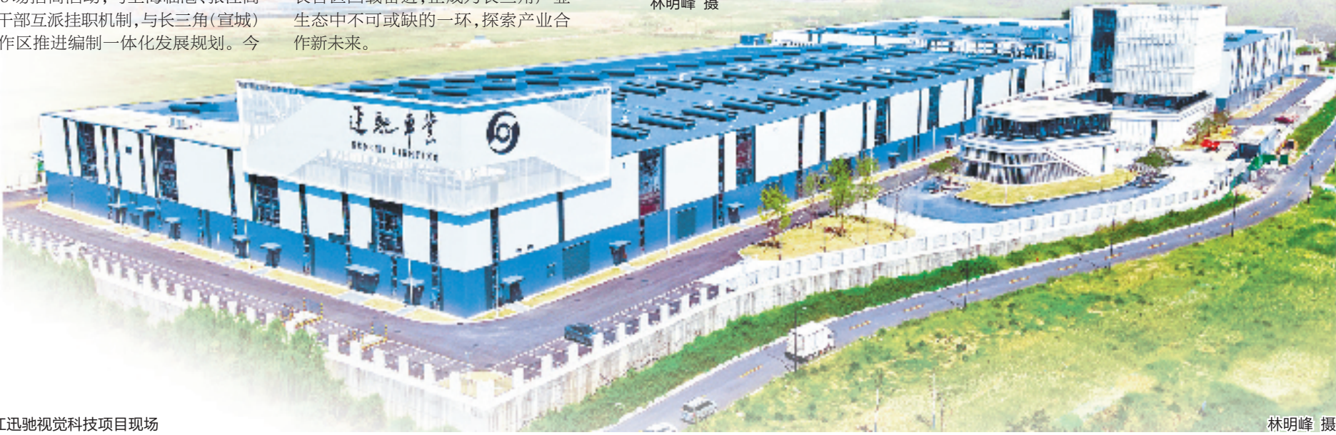
浙江迅驰视觉科技项目现场

未来的长合区,必将以更加昂扬的姿态,在长三角一体化发展的宏大叙事中写下浓墨重彩的浙江篇章。