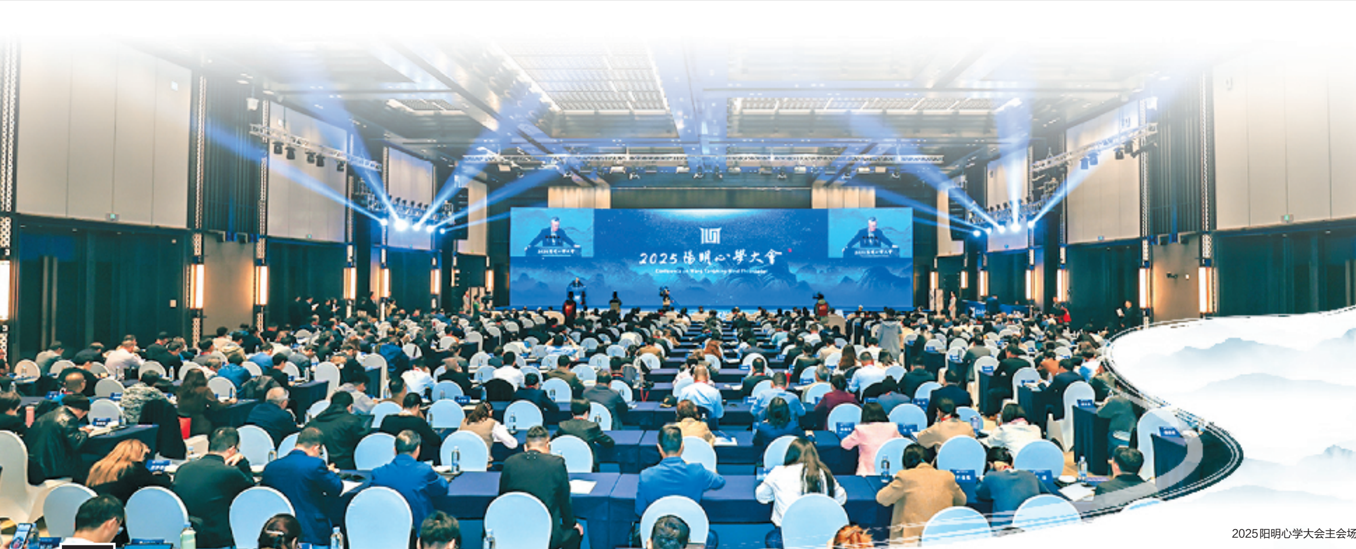
2025阳明心学大会主会场