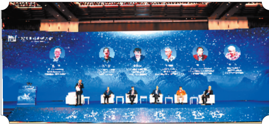
2025阳明心学大会稽山论道

雕花窗棂下，学者围坐论道，重现阳明先生当年“诗酒酬唱、讲学论道”的雅事；青石板路上，参会者穿梭其间，在“沉浸式”体验中触摸心学源流。“置身此处，