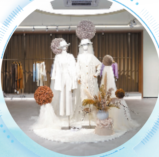
“濮院毛衫”数字贸易平台线下选品中心