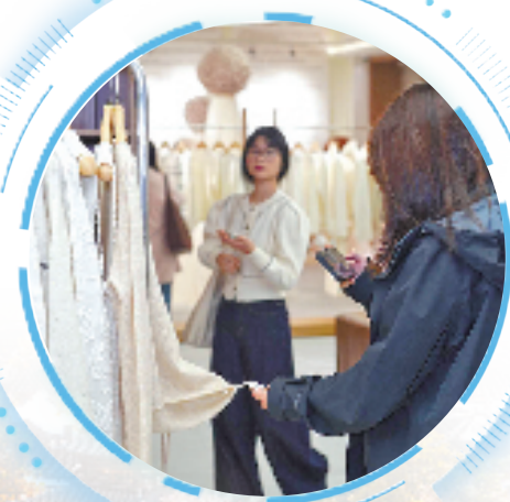
消费者在挑选毛衫

“我们绝不是简单的在线上开店,而是要整合全产业链资源,建立贯通知识产权、质量管控等服务的全链路生态系统。”濮院镇相关负责人说,每件毛衫从原料进厂到成品出库,历经十几道严苛检验评分,小到羊绒纤维细度,大到设计版权归属,都能通过这张数字身份证获悉,以此建立起从纱线到成衣的全流程