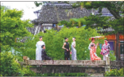
游客在濮院时尚古镇内打卡拍照