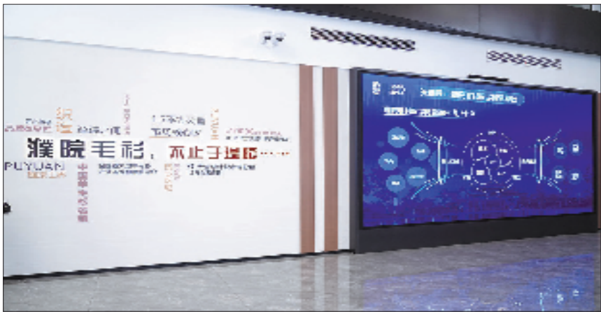
“濮院毛衫”数字贸易平台线下展厅

眼下,平台正以“内贸筑基+外贸飞跃”双轮驱动剑指全球。未来,“濮院毛衫”数字贸易平台外贸板块上线后,将会覆盖全球72个国家,触达170个全球仓库,培育1000家线上线下中小零售商,拓展境外贸易,打造国内、国外协同共生的服装供应链生态系统。