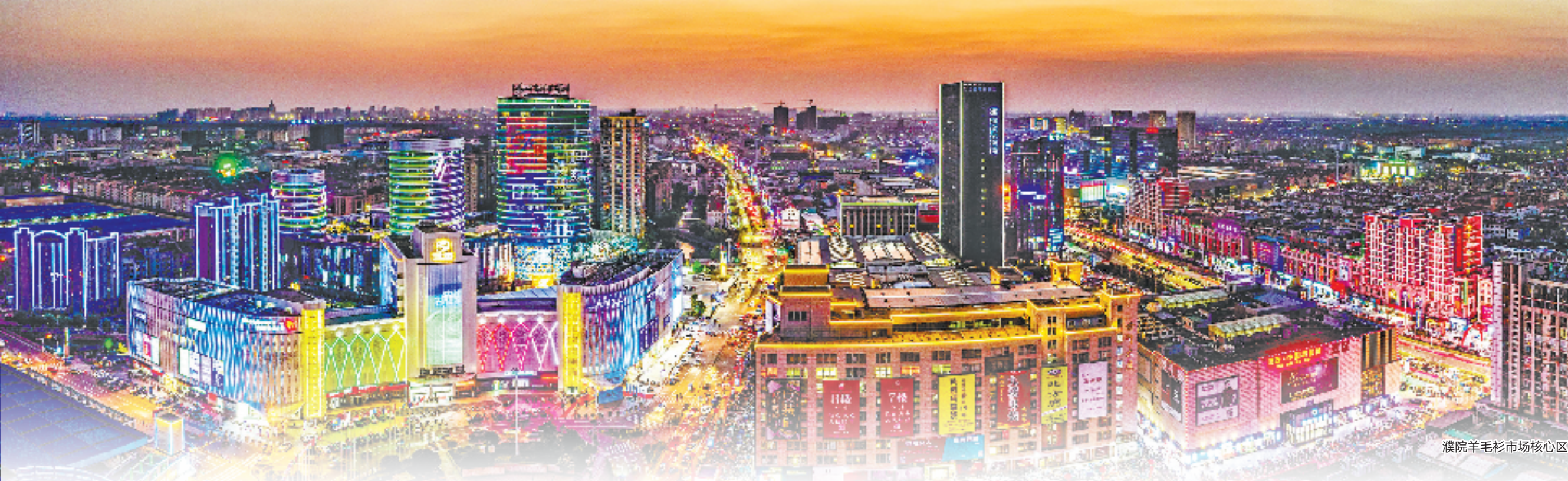
濮院羊毛衫市场核心区