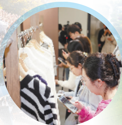
消费者扫描毛衫上的“数字身份证”