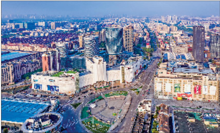
濮院羊毛衫交易市场