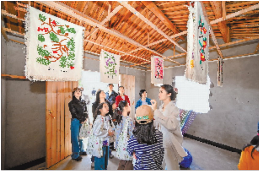
图为由鸡舍改造而来的“川里田野”小院里，正在举办艺术展。

而沿河一带的老宅与边角地日渐荒芜。前两年，村里引入资本，将其改造成12栋纯白色建筑的创客空间。但园区多数空间长期空置，最初因颜值吸引