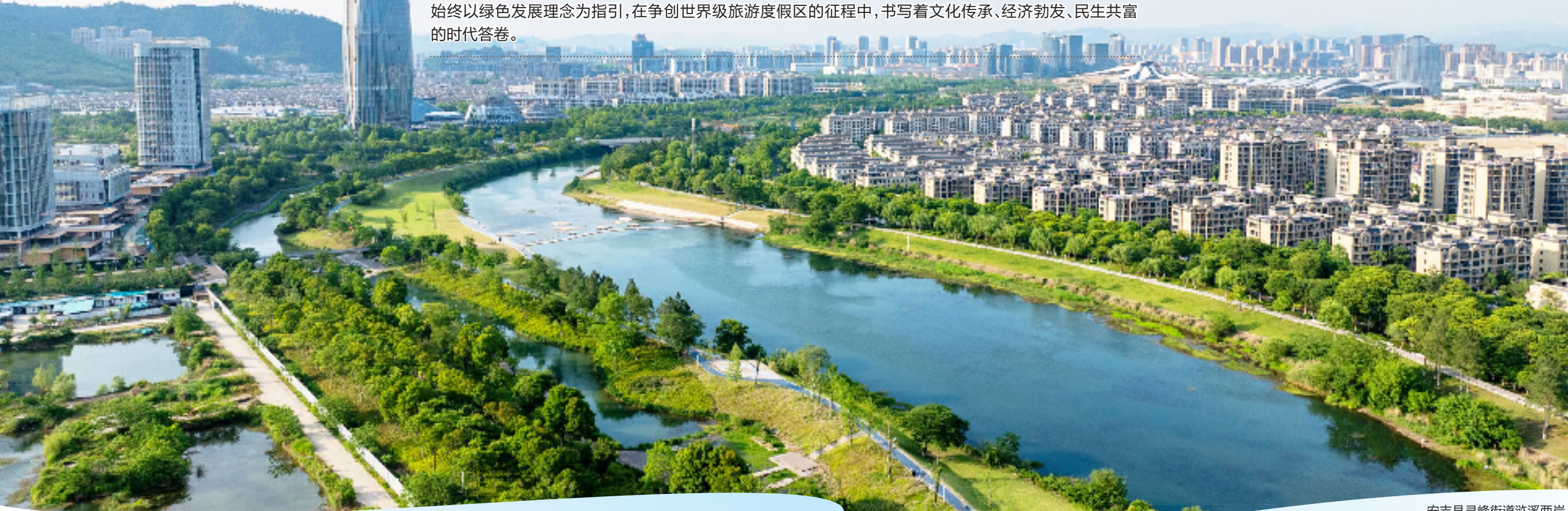
安吉县灵峰街道汧溪两岸

作为安吉“国际化绿色山水美好城市”建设的核心板块,灵峰自2018年创成国家级旅游度假区以来,始终以绿色发展理念为指引,在争创世界级旅游度假区的征程中,书写着文化传承、经济勃发、民生共富的时代答卷。