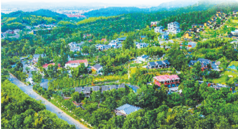
“小瘾·半日村”全貌图

科技创新平台建设同步发力。浙江中力机械股份有限公司嗅到了新的机遇,与灵峰“智慧谷”签约摩佛智能研究院项目,将企业“大脑”研究院迁至安吉。“‘智慧谷’定位互联网企业总部、科创研发、生命健康(高端医美)及其他高质量新经济业态,力争在年底形成项目集聚。”灵峰“智慧谷”推进专班负责人信心十足。