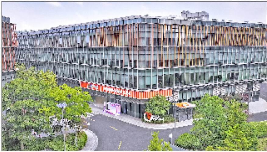
青橙国际创新创业中心