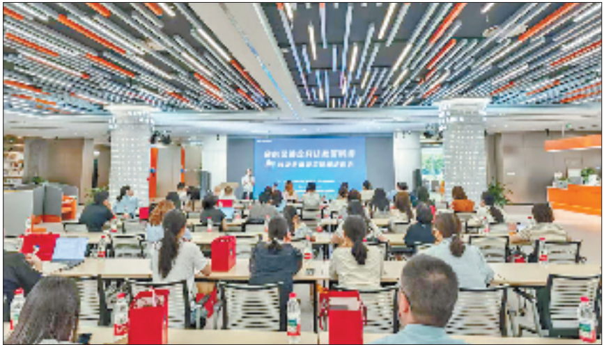
在青橙国际创新创业中心开展的企业培训

吸引力。一方面,街道联合阿里巴巴园区运营方组建专项工作组,推动阿里生态资源落地转化;建立大咖导师“传帮带”机制,用实战经验为青年人才打消创业顾虑;打造电商直播基地,提供数字经济创业场景,降低人才创业门槛;组建“青橙十派”社群,促进人才间的互通合作,形成“以才引才”的良性循环。另一方面,中心集成政务服务,开展“三送三给一揭榜”专项行动——“助企智囊团”为企业送政策、送服务、送要素,累计化解政策咨询、资源匹配等方面的问题50项;提供社保、公积金、公司设立登记等基础政务服务400余项,以及人才子女就学等增值服务78项,紧扣“黄金68条”等政策申报节点开展专项培训23场,用