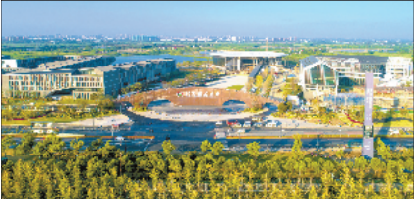
北京理工大学长三角研究院(嘉兴)

以赛为媒，嘉兴不仅选出了好项目，更链接了全球智慧。作为嘉兴招才引智的“王牌赛事”，“红船杯”已连续举