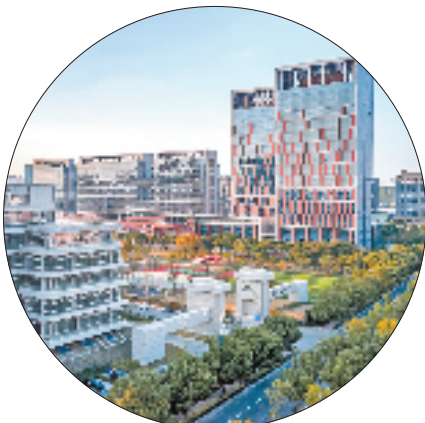
浙江清华长三角研究院

让人才“活水”涌流，发展才有源头。嘉兴积极推进“科技副总”“产业教授”“校（企）双聘”等工作，打破高校与企业的“人才壁垒”，推动高层次人才有序流动共享。在完成省科技副总、产业教授遴选的“规定动作”基础上，嘉兴又尝试“自选动作”，将遴选范围拓展至省外，放宽重点产业领域人选要