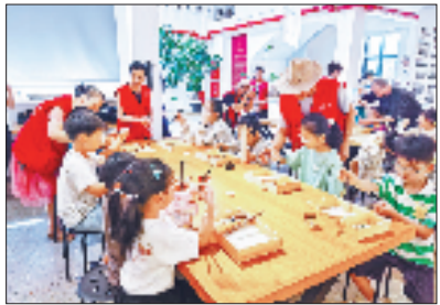
老年人和儿童在“朝夕相伴”双龄共养服务综合体里自然互动

临海市委组织部相关负责人介绍,接下来,临海将进一步发挥党建引领作用,聚焦公共服务一体化,有序推进“朝夕相伴”双龄共养对象扩面、服务提标、场景拓展,全力打响“朝夕相伴”工作品牌。