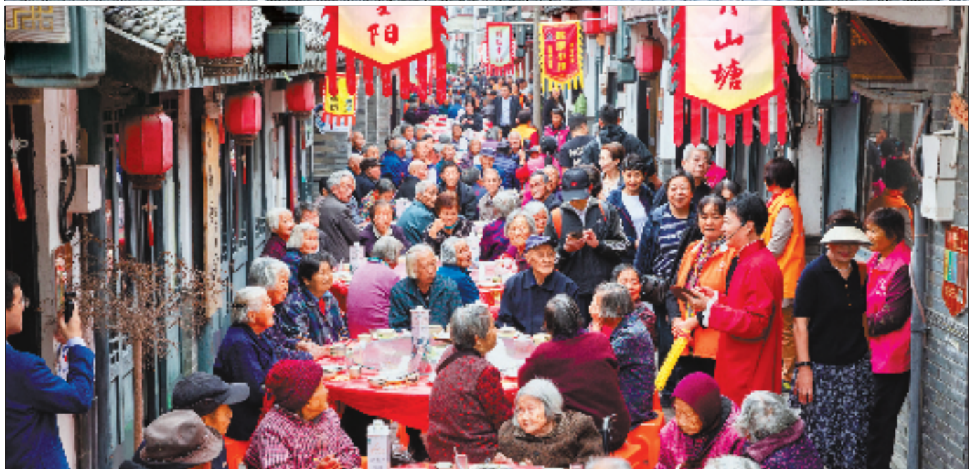
浙沪长街宴 共迎重阳节

10月26日，平湖市广陈镇，浙沪南北山塘村一起举办了长街宴活动。来自两地的300余位老人相聚山塘老街，吃家宴、话家常，共迎重阳佳节。